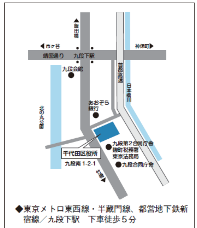
◆東京メトロ東西線・半蔵門線、都営地下鉄新宿線/九段下駅 下車徒歩 5 分