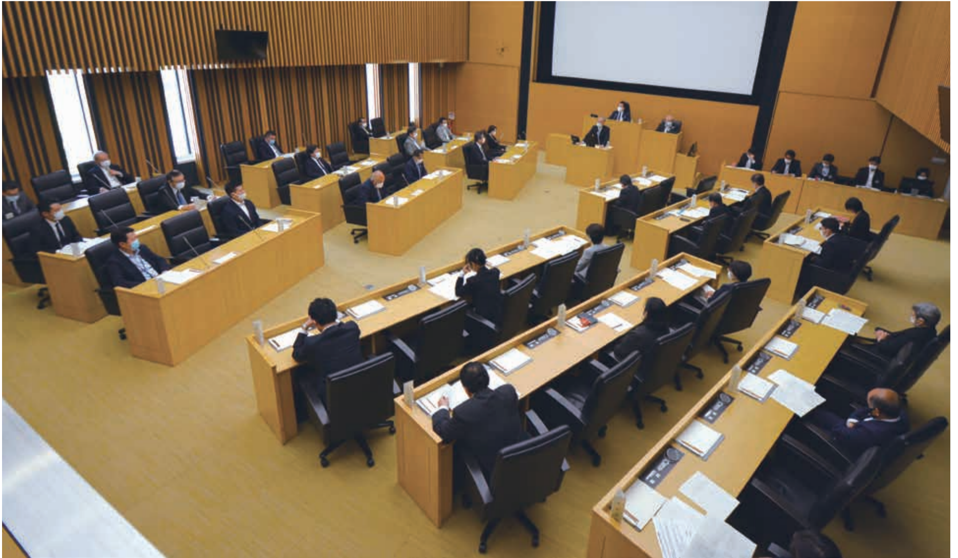
令和2年第1回臨時会 審議の様子（新型コロナウイルス感染症防止対策として議席の間隔を空けて着席）