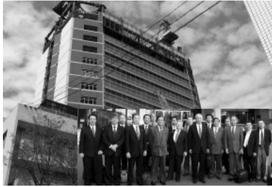
〈鈴鹿市役所・三重県庁〉

名古屋市長 立鶴舞中央 図書館は、従来から市の中心的図書館として機能し、積極的に整理部門の集中化を行い、各図書館の蔵書の書誌情報の共有化に取り組みんでいます。